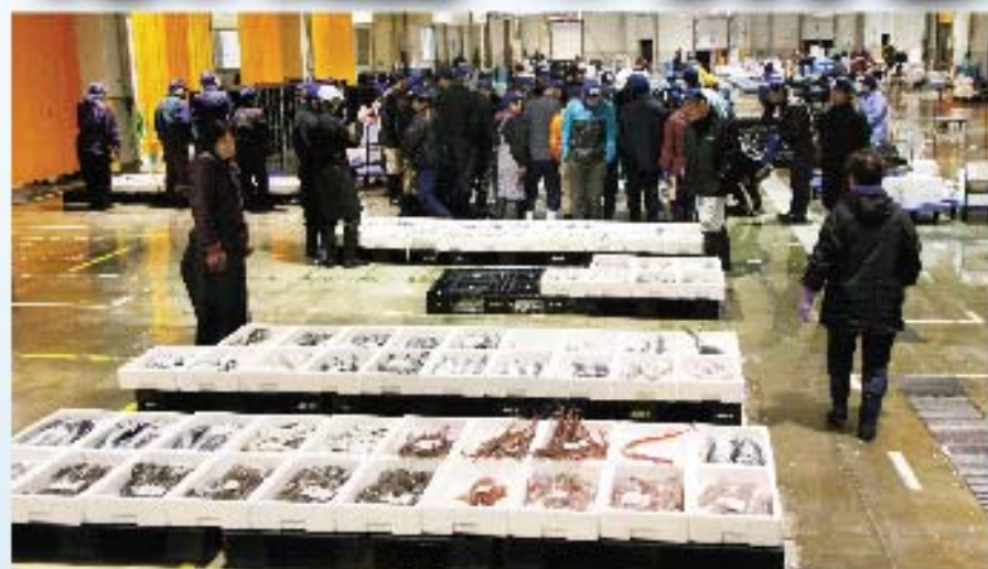
※写真はすべてイメージです。