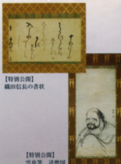
【特別公開】織田信長の書状