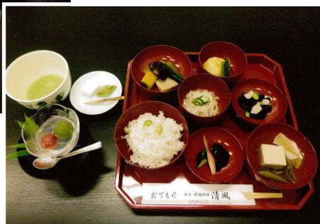
地元の自然素材を使った精進料理